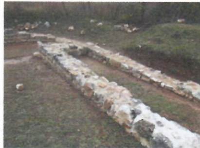
1. Prostorije K i M prije konzervacije 2. Prostorija M poslije konzervacije