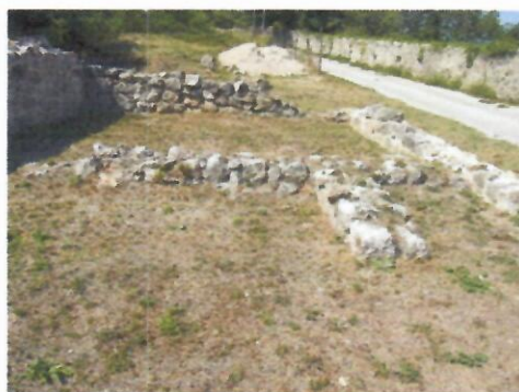
3. Zidovi SJ 6, SJ 7 i SJ 8 prije konzervacije