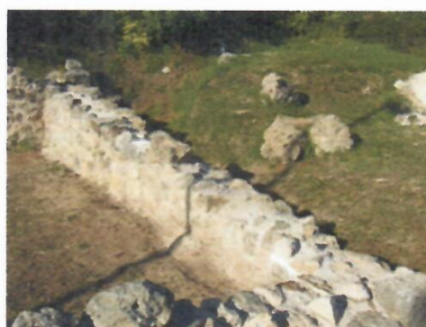
2. Zid SJ 6 poslije konzervacije