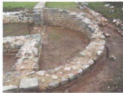
3. Prostorija K prije konzervacije 4. Prostorija K poslije konzervacije