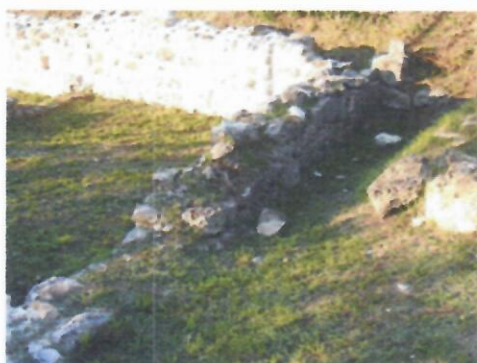
1. Zid SJ 6 prije konzervacije

Položaj je prvi put zabilježen na karti iz 1700. - 1799. autora Saveria Avesana, gdje se uz gradsko naselje nalaze Loredanova vrata, Postaja zvana Pijevac, Vrata Cornera, Vrata Molina, Crkva sv. Duha ili crkva zvana Od duša, a neposredno uz Prebivalište Providura nalazi i ovaj objekt zabilježen kao Vojarna konjice.